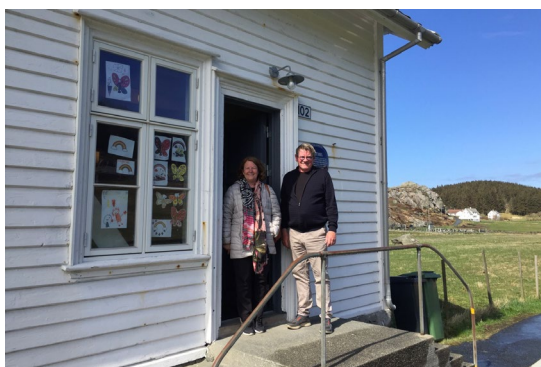
Revisor og nestleder 07.05.21