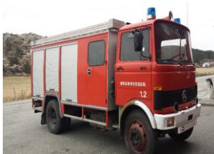
Lekkasje i høytrykkspumpa er avdekket