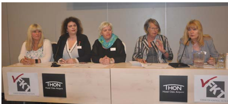
Fagkonferanse på Gardermoen 2015