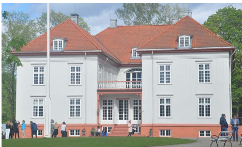
Utflukt til Eidsvolls- bygningen