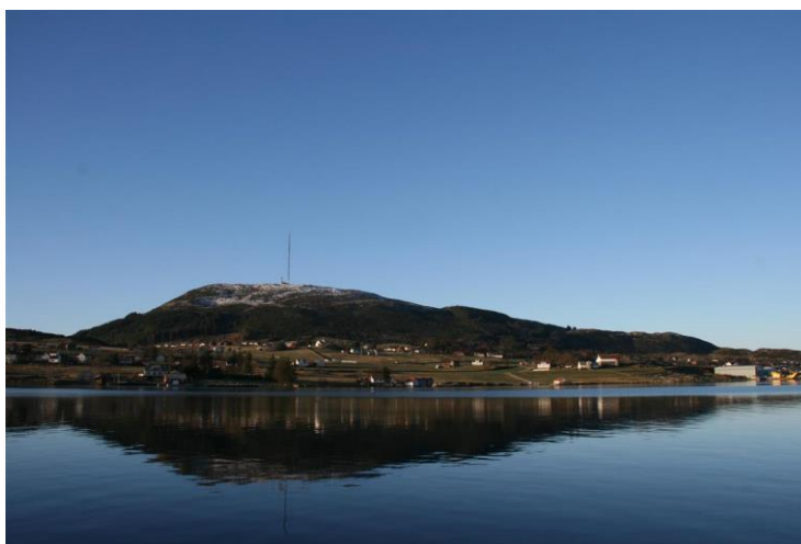
FIGUR 1: FOTOGRAF JARDAR HAVIKBOTN