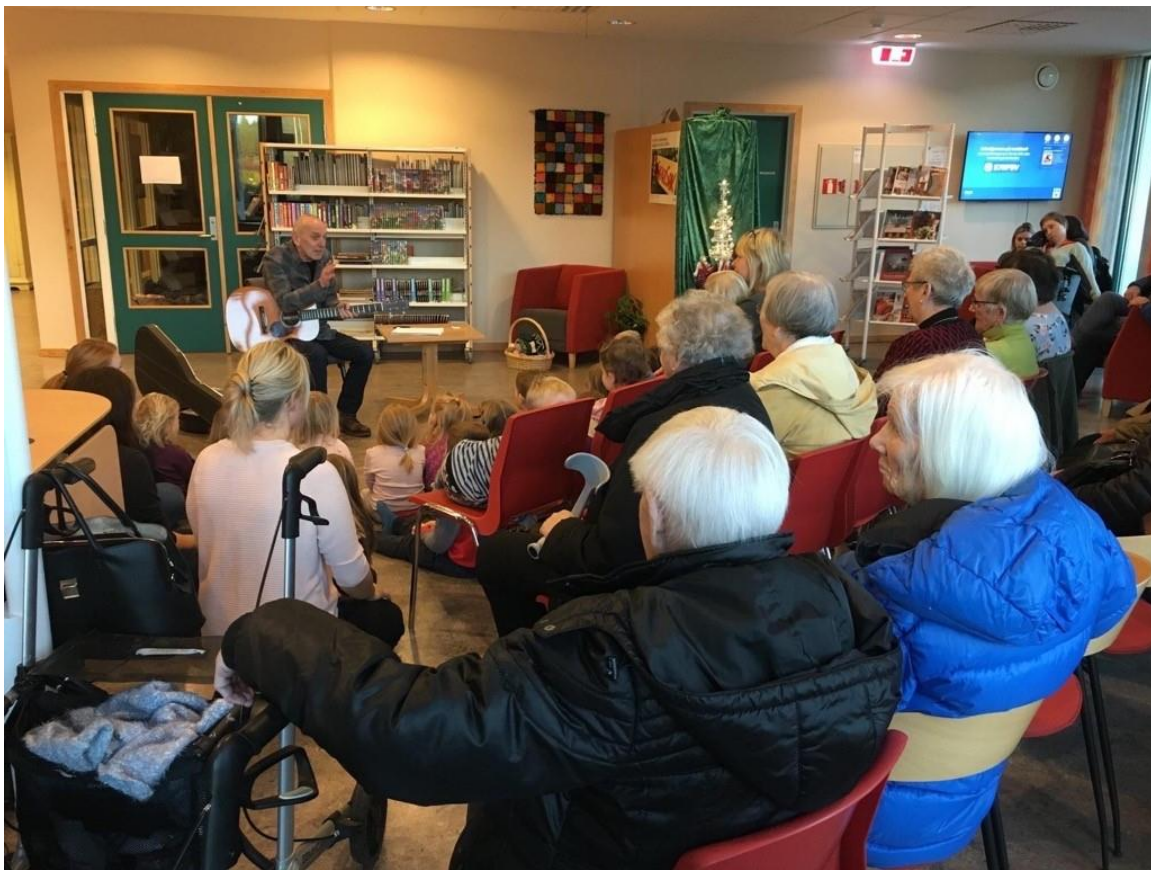
Songstund på biblioteket.

Kunst og kulturformidling skjer i stor grad gjennom samarbeid mellom kultureininga og bibliotekseininga og dei andre einingane i kommunen. Biblioteket vert i stor grad nytta som arena for formidling, både i forhold til program som er i den kulturelle spaserstokken og den vekentlege tysdagskafeen.