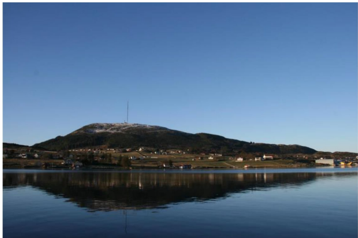
FIGUR 1: