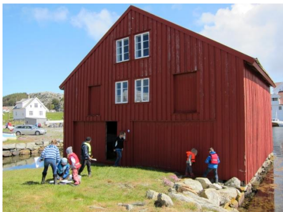
Museet for Haugalandet arrangerte aktivitetsdag for skoleelevene sommeren 2012.