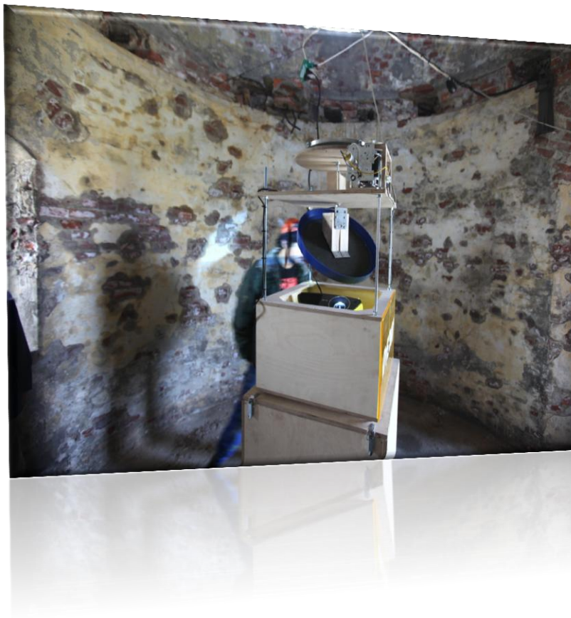
Fra utstillingen Øye 360 grader i gamle fyret sommeren 2012 «Bureau detours»

Utsira fyrstasjon skal ivaretas som et fredet kulturmiljø som er tilgjengelig for publikum gjennom utstillinger og ulike aktiviteter.