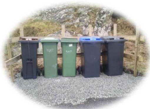
Her er et flott eksempel på plassering av de søppelbeholdere på Utsira: I Varden