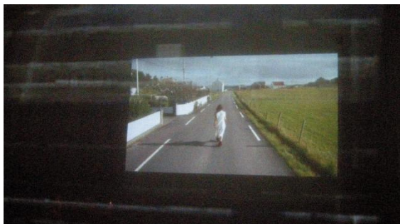
Performance tropp fra Normandie i Sirakompasset.