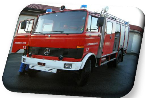
Vår tredje brannbil ankom Utsira 19. jan 2011, ble betalt i 2012!